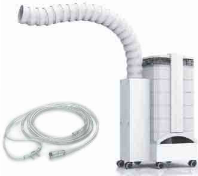
Kofferdamm, Sauerstoff-Zufuhr, CleanUp Sauger, IQ-Air und Mikronährstoffe