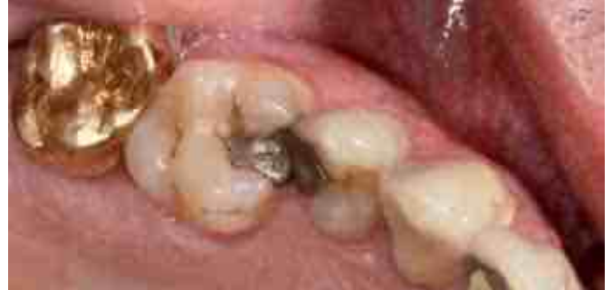
Klassisches Szenario: Goldkrone neben Amalgamfüllung – der Batterieeffekt.

unspezifische Symptome wie Stechen oder Druck in der Brust, unerklärtes Herzrasen, Tinnitus und Hörverlust, etc. sein [50].